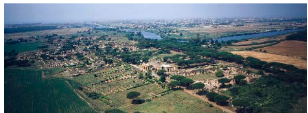
NECROPOLI OSTIA ANTICA E FOCE FIUME TEVERE: Nr.14 foto E0185